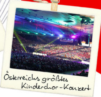
Österreichs größtes Kinderchor-Konzert