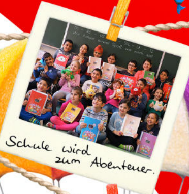
Schule wird zum Abenteuer.