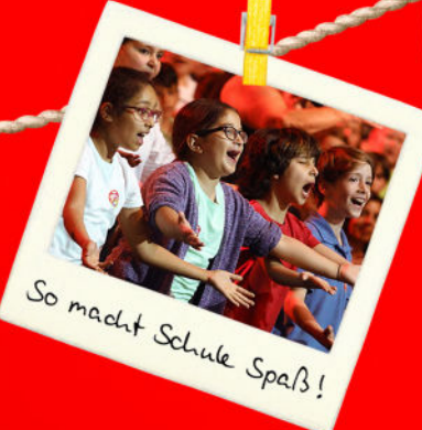
So macht Schule Spaß!