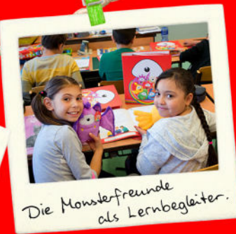
Die Monsterfreunde als Lernbegleiter.