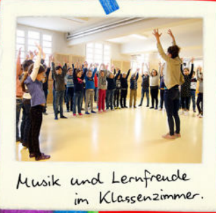
Musik und Lernfreunde im Klassenzimmer.