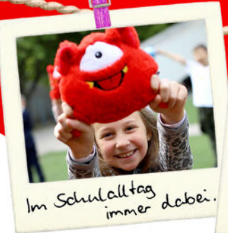
Im Schulalltag immer dabei.